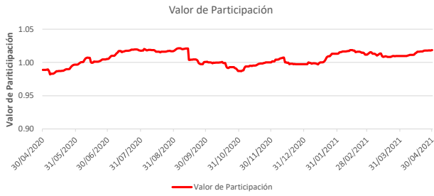
Fondo BAC San José Sin Fronteras No diversificado: Valor de Participación Del 30 de Abril de 2020 al 30 de Abril de 2021