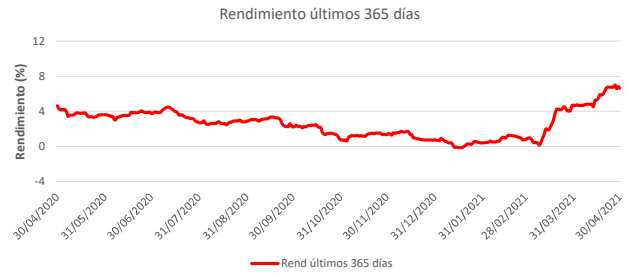
Fondo BAC San José Sin Fronteras No diversificado: Rendimiento últimos 365 días Del 30 de Abril de 2020 al 30 de Abril de 2021