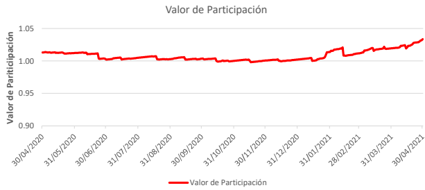
Fondo BAC San José Propósito No diversificado: Valor de Participación Del 30 de Abril de 2020 al 30 de Abril de 2021