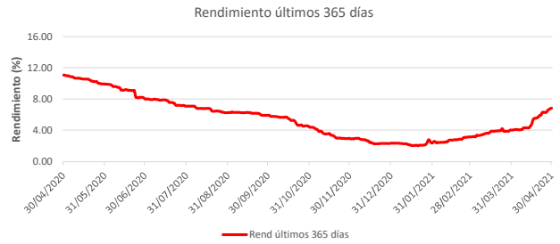
Fondo BAC San José Propósito No diversificado: Rendimiento últimos 365 días Del 30 de Abril de 2020 al 30 de Abril de 2021