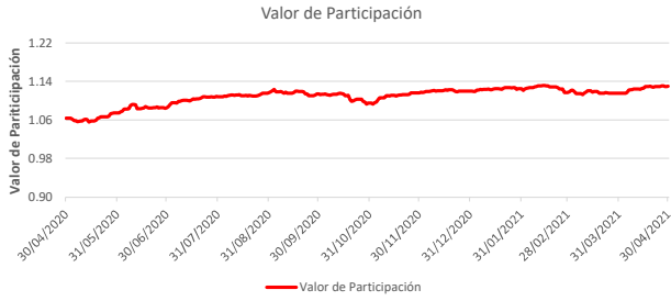
Fondo BAC San José Posible No diversificado: Valor de Participación Del 30 de Abril de 2020 al 30 de Abril de 2021