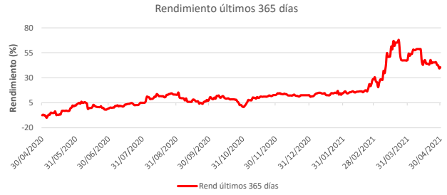
Fondo BAC San José Millennium No diversificado: Rendimiento últimos 365 días Del 30 de Abril de 2020 al 30 de Abril de 2021