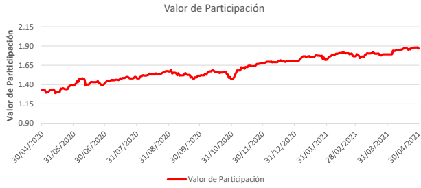
Fondo BAC San José Millennium No diversificado: Valor de Participación Del 30 de Abril de 2020 al 30 de Abril de 2021