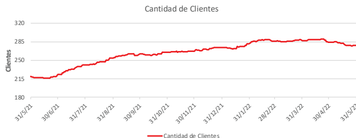
Fondo BAC San José Sin Fronteras No diversificado: Cantidad de clientes Del 31 de Mayo de 2021 al 31 de Mayo de 2022