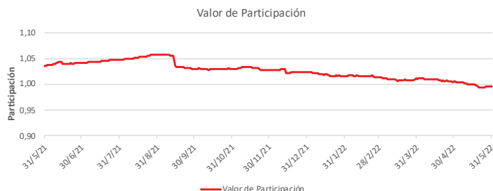
Fondo BAC San José Sin Fronteras No diversificado: Valor de Participación Del 31 de Mayo de 2021 al 31 de Mayo de 2022