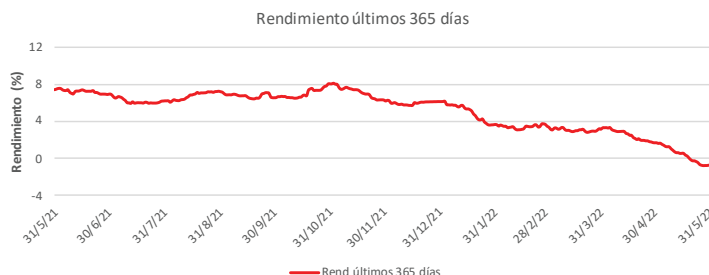
Fondo BAC San José Sin Fronteras No diversificado: Rendimiento últimos 365 días Del 31 de Mayo de 2021 al 31 de Mayo de 2022