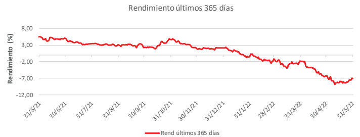
Fondo BAC San José Posible No diversificado: Rendimiento últimos 365 días Del 31 de Mayo de 2021 al 31 de Mayo de 2022