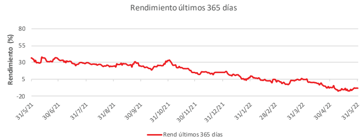
Fondo BAC San José Millennium No diversificado: Rendimiento últimos 365 días Del 31 de Mayo de 2021 al 31 de Mayo de 2022