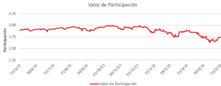
Fondo BAC San José Millennium No diversificado: Valor de Participación Del 31 de Mayo de 2021 al 31 de Mayo de 2022