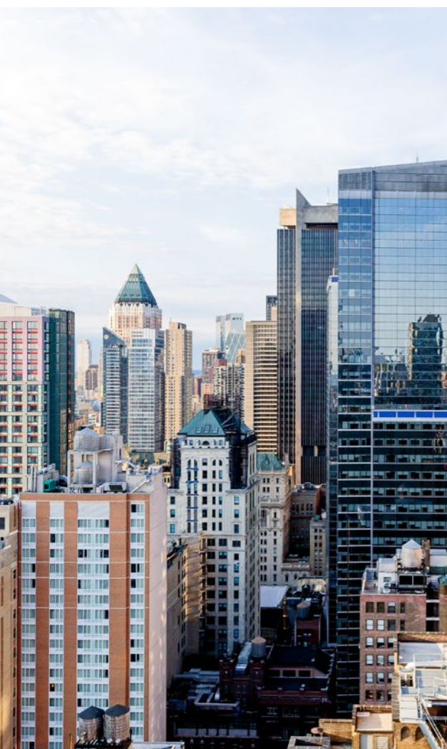
Fiduciario (Fiduciario externo a BAC Credomatic)