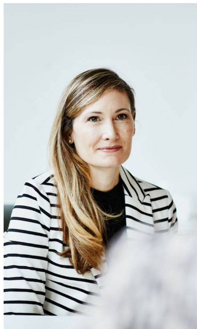
Fideicomitente (Cliente deudor)