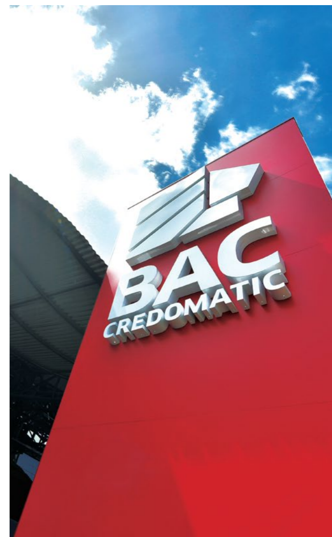
Fideicomisario (BAC Credomatic)